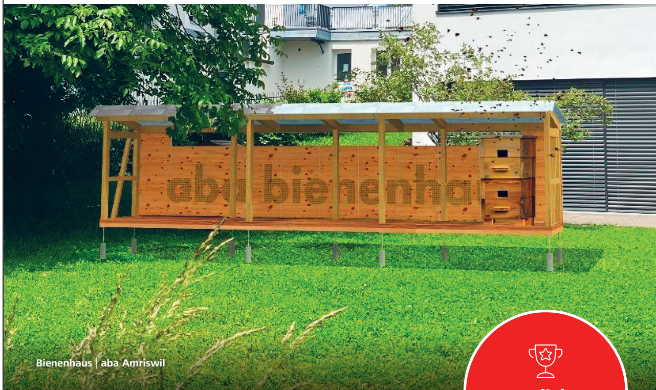
Bienenhaus | aba Amriswil