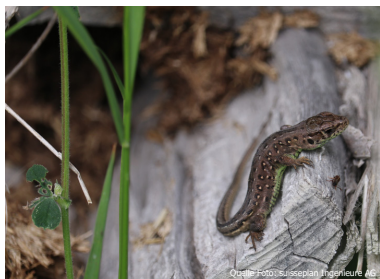
Junge Zauneidechse in einer Holzbeige