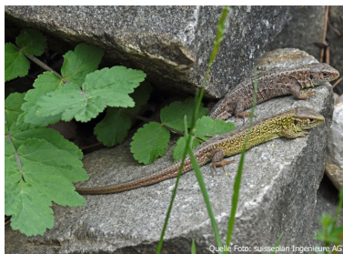
Zauneidechsen-Paar (v.: Männchen, h.: Weibchen)