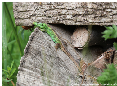
Leuchtend grüne Färbung des Zauneidechsen Männchens