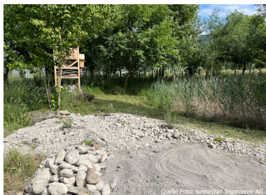
Offene Bodenstellen dienen als Eiablageplätze