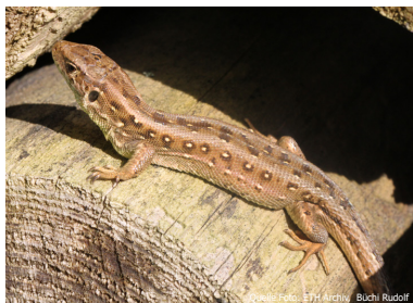
Zauneidechsen Weibchen sind bräunlich gefärbt