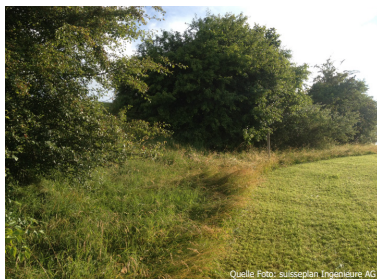
Krautsäume bilden wichtige Lebensräume